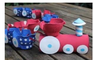
EGG CARTON TRAIN