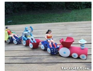
Tío Crafty Todd